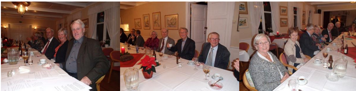
Stemningen rundt bordet var upåklagelig !