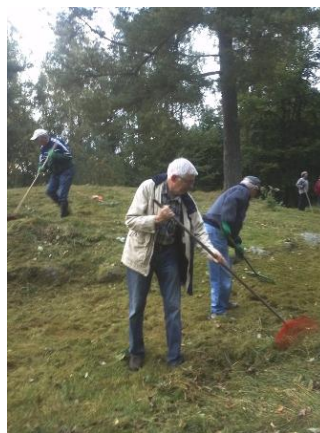
mens Past President og andre svinger rivene