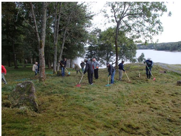
Flott arbeidsmiljø på Hella

Det møtte 16 av våre medlemmer til den tradisjonelle dugnaden, som er et samarbeid med Nøtterøy Historielag. Til sammen var vi 25 personer som deltok i arbeidet. Formålet med dugnaden er å holde gress og busker nede slik at området blir ryddig og tiltalende.